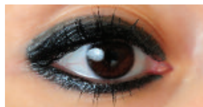
A szemem csak szempillaspirál van

Előnye, hogy természetes hatású, mintha ceruzával vagy porral festette volna ki magát a vendég. Fiatalabbaknak és idősebbeknek egyaránt jól áll, csupán a vastagsága és a szín választása tér el a vendég korának megfelelően. Ezzel elkerülhető, hogy a szemek túl intenzíven kihúzottak és ezért túlsminkeltnek